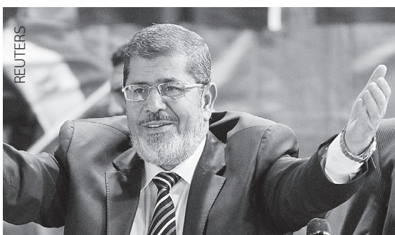
Πρώτος με 23% αναδείχθηκε ο Μοχάμεντ Μουρσί, σύμφωνα με τις εκτιμήσεις.