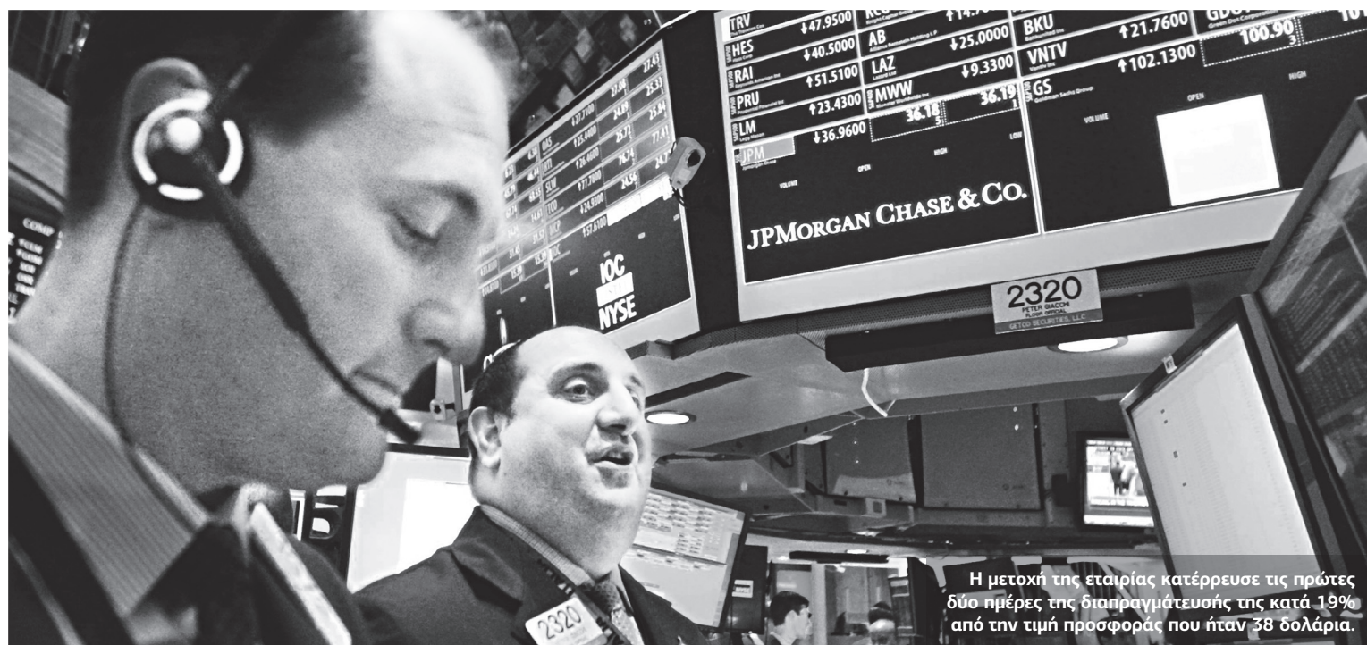
Η μετοχή της εταιρίας κατέρρευσε τις πρώτες δύο ημέρες της διαπραγμάτευσής της κατά 19% από την τιμή προσφοράς που ήταν 38 δολάρια.

Ο Μαρκ Ζούκερμπεργκ και η Morgan Stanley ήδη έχουν αρχίσει να δέχονται αγωγές από επενδυτές για την απόκρυψη των προγνώσεων