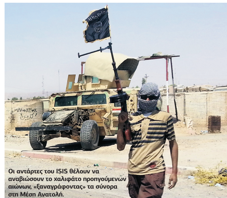
Οι αντάρτες του ISIS θέλουν να αναβιώσουν το χαλιφάτο προηγούμενων αιώνων, «ξαναγράφοντας» τα σύνορα στη Μέση Ανατολή.

Οι αντάρτες του ISIS, σουνίτες φονταμενταλιστές, που θέλουν να αναβιώσουν το χαλιφάτο προηγούμενων αιώνων στη Μέση Ανατολή, αφού διέλυσαν τη Συρία, χωρίς ωστόσο να ανατρέψουν τον Μπασάρ Ασαντ , μέσα σε δέκα ημέρες κατέλαβαν το ένα τρίτο του Ιράκ και κατευθύνο-