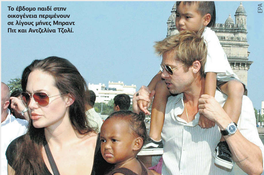
Το έβδομο παιδί στην οικογένεια περιμένουν σε λίγους μήνες Μπραντ Πιτ και Αντζελίνα Τζολί.

και αν προσπαθήσουν ών τους, της 12χρονης χρονου Τζακ, από τότε τον έρωτά τους σε ένα ας Γαλλίας «έχουν αλ- λύ», όπως διαπιστώνει