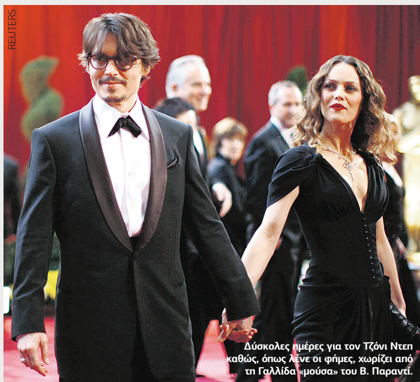
Δύσκολες ημέρες για τον Τζόνι Ντεπ καθώς, όπως λένε οι φήμες, χωρίζει από τη Γαλλίδα «μούσα» του Β. Πارانτί.

► ΤΙΤΛΟΙ ΤΕΛΟΥΣ ΣΤΗ ΣΧΕΣΗ ΤΟΥ ΜΕ ΤΗ Β. ΠΑΡΑΝΤΙ. ΕΓΚΥΟΣ ΣΤΟΝ ΤΡΙΤΟ ΜΗΝΑ Η Α. Τ