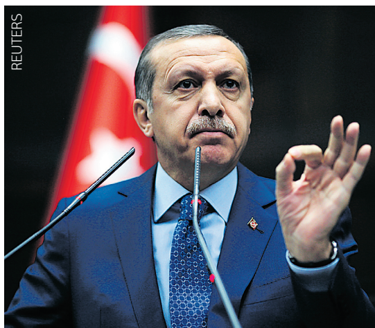
Ουδενμία ευθύνη φέρει για τις υποκλοπές ο Ταγίπ Ερντογάν, ο οποίος ρίχνει το φταίξιμο στο ισλαμικό τάγμα του Φετχουλάχ Γκιουλέν.

ΤΗΝ ΩΡΑ ΠΟΥ ΕΚΑΤΟΜΜΥΡΙΑ Ευρωπαίοι είναι άστεγοι, αίσθηση προκαλεί δημοσίευμα του «Guardian», σύμφωνα με το οποίο 11 εκατομμύρια σπίτια σε όλη την Ευρώπη παραμένουν άδεια. Η Ισπανία έχει την πρωτιά με 3,4 εκατομμύρια και ακολουθούν Γαλλία και Ιταλία με δύο εκατομμύρια σπίτια η καθεμία. Στη Γερμανία τα άδεια σπίτια είναι 1,8 εκατομμύρια και στη Βρετανία 700.000. Χιλιάδες άδεια σπίτια υπάρχουν ακόμη σε Ιρλανδία, Ελλάδα και Πορτογαλία, σύμφωνα με τον «Guardian». Πολλά από αυτά κτίστηκαν σε τουριστικές περιοχές την περίοδο της κατασκευαστικής έξαρσης το 2007 και το 2008. Οργανώσεις πολιτών χαρακτηρίζουν το γεγονός σοκαριστικό, τη στιγμή που εκατομμύρια πολίτες στην Ευρώπη χρειάζονται σπίτι. Σύμφωνα με εκτιμήσεις, μόνο τα μισά από αυτά τα σπίτια να δίνονταν στους έχοντες ανάγκη, δεν θα υπήρχαν άστεγοι στην Ευρώπη.