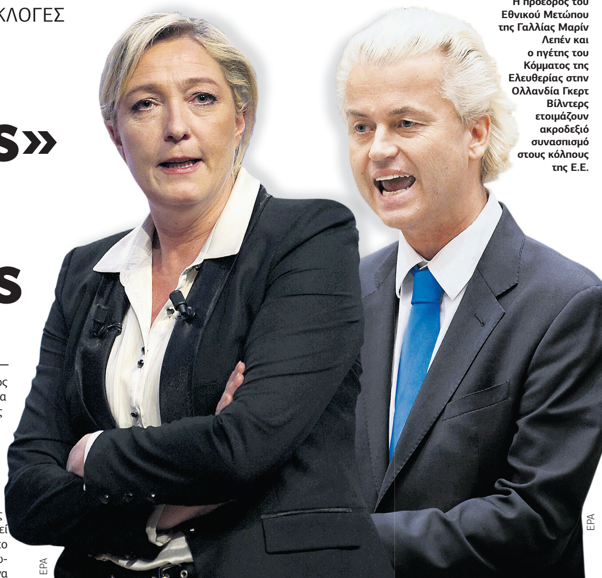
Η πρόεδρος του Εθνικού Μετώπου της Γαλλίας Μαρίν Λεπέν και ο ηγέτης του Κόμματος της Ελευθερίας στην Ολλανδία Γκερτ Βίλντερς ετοιμάζουν ακροδεξιό συνασπισμό στους κόλπους της Ε.Ε.

Οι ευρωσκεπτικιστές στην Ευρώπη εκπροσωπούνται από το Κόμμα της