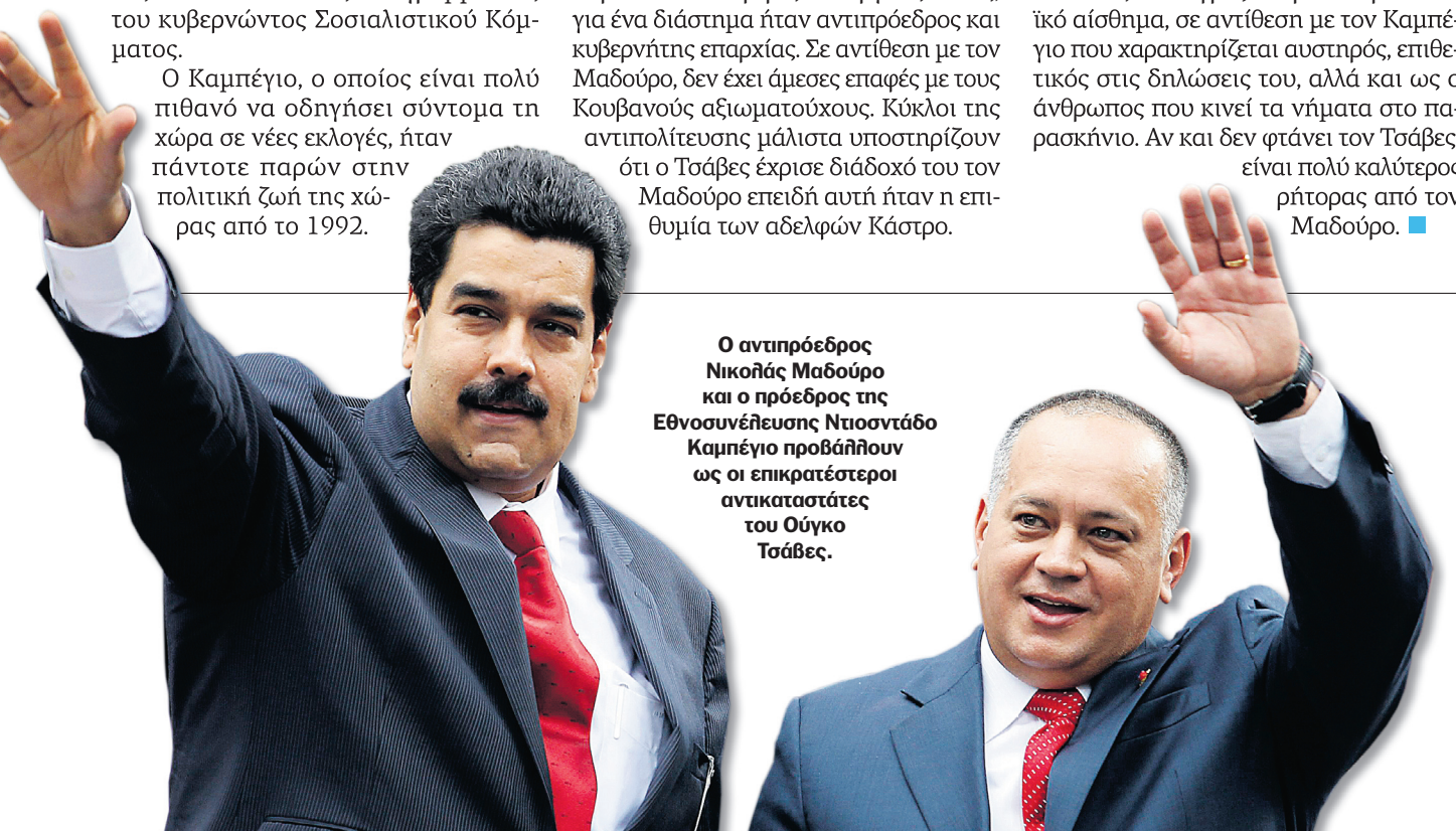
Ο αντιπρόεδρος Νικολάς Μαδούρο και ο πρόεδρος της Εθνοσυνέλευσης Ντιοσντάδο Καμπέγιο προβάλλουν ως οι επικρατέστεροι αντικαταστάτες του Ούγκο Τσάβες.

Ο Μαδούρο είναι πιο προβεβλημένος πολιτικός και εκφράζει περισσότερο το λαϊκό αίσθημα, σε αντίθεση με τον Καμπέγιο που χαρακτηρίζεται αυστηρός, επιθετικός στις δηλώσεις του, αλλά και ως ο άνθρωπος που κινεί τα νήματα στο παρασκήνιο. Αν και δεν φτάνει τον Τσάβες, είναι πολύ καλύτερος ρήτορας από τον Μαδούρο. ■