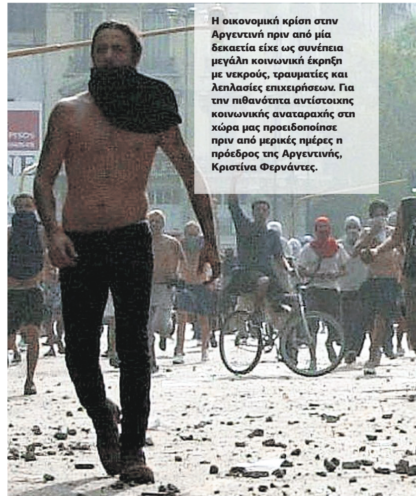
Η οικονομική κρίση στην Αργεντινή πριν από μία δεκαετία είχε ως συνέπεια μεγάλη κοινωνική έκρηξη με νεκρούς, τραυματίες και λεηλασίες επιχειρήσεων. Για την πιθανότητα αντίστοιχης κοινωνικής αναταραχής στη χώρα μας προειδοποίησε πριν από μερικές ημέρες η πρόεδρος της Αργεντινής, Κριστίνα Φερνάντες.

Μόνη ελπίδα, να μην επαληθευθούν τα δυσοίωνα σενάρια των αναλυτών