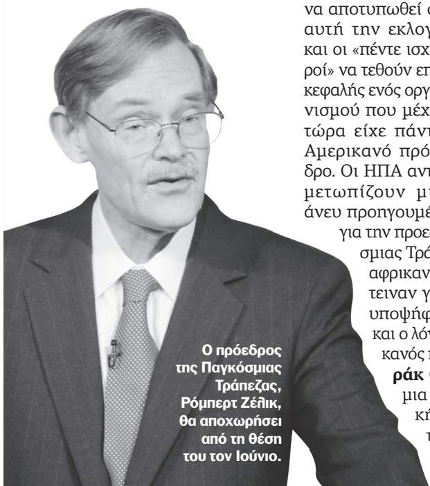
Ο πρόεδρος της Παγκόσμιας Τράπεζας, Ρόμπερτ Ζέλικ, θα αποχωρήσει από τη θέση του τον Ιούνιο.

Ενας ακόμη σοβαρός λόγος για τον οποίο οι ΗΠΑ δεν θέλουν να «χάσουν» την Παγκόσμια Τράπεζα είναι γιατί έχουν θορυβηθεί από την πρωτοβουλία των πέντε χωρών που απαρτίζουν τους BRICS. Σε πρόσφατες δηλώσεις του ο απερχόμενος πρόεδρος της Τράπεζας Ρόμπερτ Ζέλικ είπε ότι η Παγκόσμια Τράπεζα θα πρέπει να στηρίξει την ίδρυση της επενδυτικής τράπεζας των BRICS, όπως στήριξε και την Ισλαμική Αναπτυξιακή Τράπεζα και το Ταμείο των χωρών του ΟΠΕΕ, και να επιδιώξει τη συνεργασία μαζί της. Σε αυτή την περίπτωση οι ΗΠΑ θα θέλουν να βρίσκονται στο κέντρο των αποφάσεων. ■