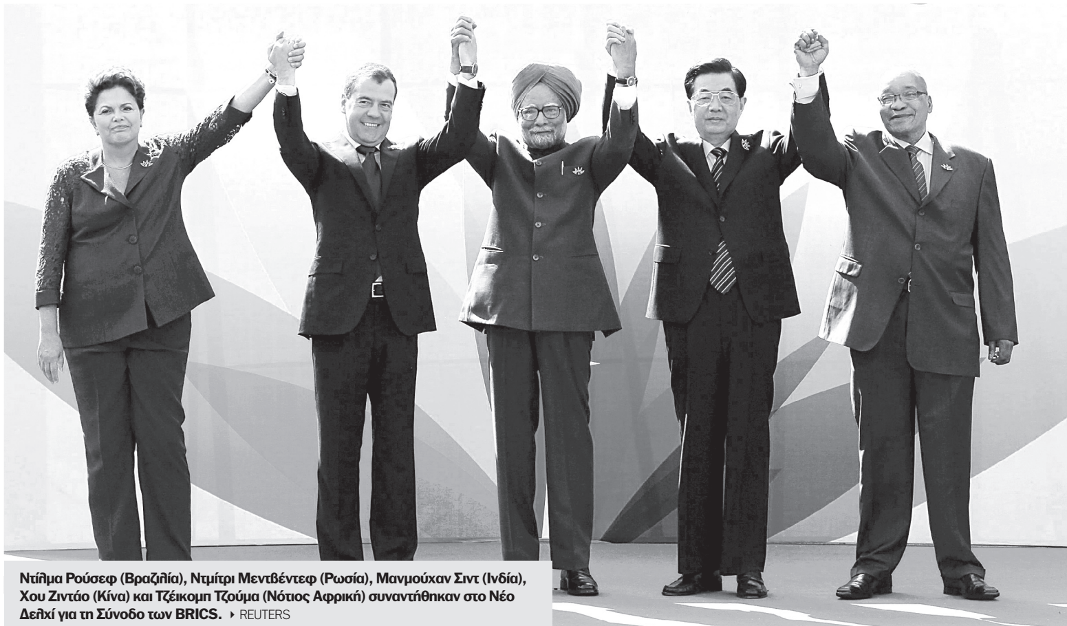
Ντίλμα Ρουσέφ (Βραζιλία), Ντμίτρι Μεντβέντεφ (Ρωσία), Μανμούχαν Σιντ (Ινδία), Χου Ζιντάο (Κίνα) και Τζέικομπ Ζούμα (Νότιος Αφρική) συναντήθηκαν στο Νέο Δελχί για τη Σύνοδο των BRICS.

«ΜΑΧΗ» ΜΕ ΤΙΣ ΗΠΑ ΩΣΤΕ Ο ΝΕΟΣ ΠΡΟΕΔΡΟΣ ΝΑ ΕΙΝΑΙ «ΔΙΚΟΣ ΤΟΥΣ» ΑΝΘΡΩΠΟΣ