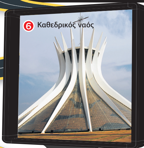
6 Καθεδρικός ναός