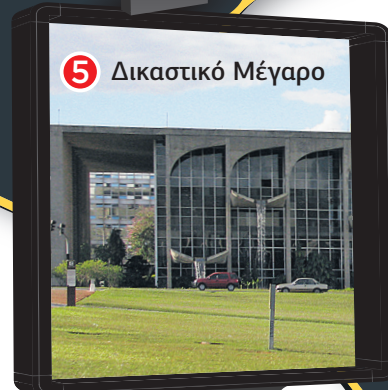
5 Δικαστικό Μέγαρο