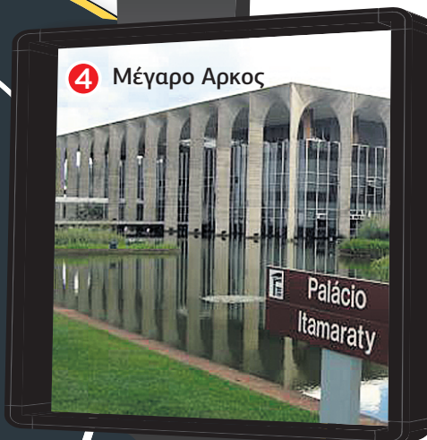
4 Μέγαρο Αρκος