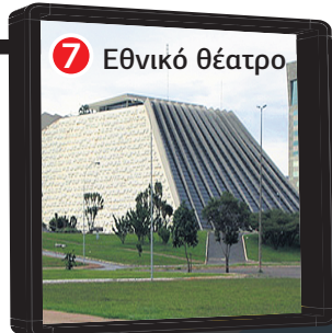
7 Εθνικό θέατρο