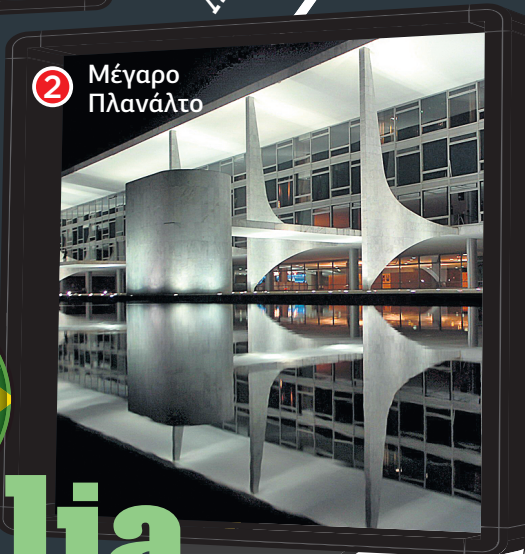
2 Μέγαρο Πλανάλτο