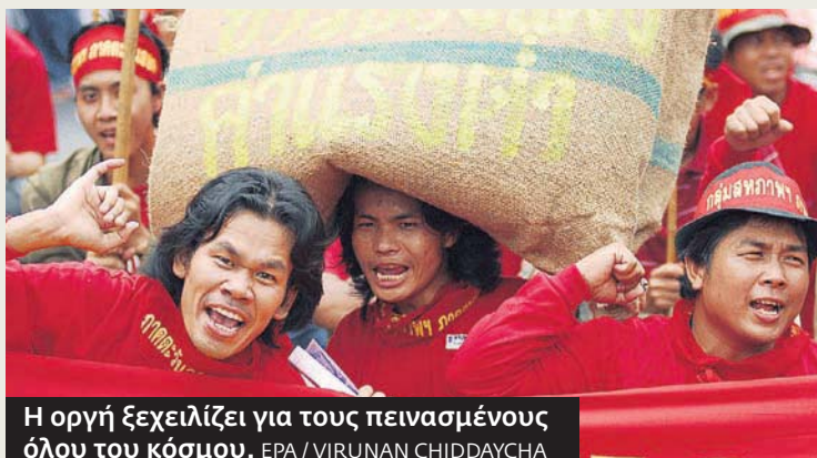
Η οργή ξεχειλίζει για τους πεινασμένους όλου του κόσμου.

217% έχουν αυξηθεί οι τιμές του ρυζιού από το 2006 και 136% οι αντίστοιχες των σιτηρών.