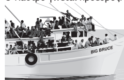
Στο διάστημα Απριλίου - Οκτωβρίου 1980, η Κούβα επιτρέπει την έξοδο 125.000 Κουβανών προς τις ΗΠΑ από το λιμάνι του Μαριέλ.

Δεκέμβριος 1976: Ο Κάστρο γίνεται πρόεδρος.