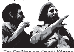
Τσε Γκεβάρα και Φιντέλ Κάστρο.

16 Απριλίου 1961: Ο Κάστρο ανακηρύσσει την επανάστασή του σοσιαλιστική. Κουβανοί εξόριστοι με την υποστήριξη των ΗΠΑ προσπαθούν να εισβάλουν στον Κόλπο των Χοίρων αλλά ανακαίτονται από τις δυνάμεις του Κάστρο.