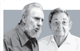
Φιντέλ και Ραούλ Κάστρο.

Ο Ραούλ Κάστρο εκλέγεται γενικός γραμματέας του Κομμουνιστικού Κόμματος και εγκρίνεται ένα ευρύ πλαίσιο οικονομικών μεταρρυθμίσεων.