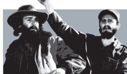
Καμίλο Σιενφουέγκος και Φιντέλ Κάστρο στην Αβάνα.

1η Ιανουαρίου 1959: Ο Μπατίστα εγκαταλείπει την εξουσία και καταφεύγει στη Δομινικανή Δημοκρατία. Ο Κάστρο εισέρχεται θριαμβευτικά στην Αβάνα.