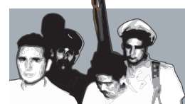
Ο Κάστρο και άλλοι κρατούμενοι μετά την αποτυχημένη επίθεση στη Μονκάντα.

26 Ιουλίου 1953: Ο Φιντέλ Κάστρο ηγείται της επανάστασης κατά του δικτάτορα Φουλχένσιο Μπατίστα, αλλά πιάνεται αιχμάλωτος και καταδικάζεται σε 15 χρόνια φυλάκιση.