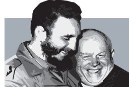
Ο Φιντέλ Κάστρο και ο Σοβιετικός ηγέτης Νικήτα Κρούτσεφ.

Φεβρουάριος 1962: Οι ΗΠΑ επιβάλλουν εμπόριο εμπόγκο στην Κούβα.