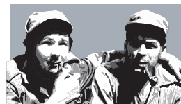
Ραούλ Κάστρο και Τσε Γκεβάρα στη Σιέρα Μαέστρα.

2 Δεκεμβρίου 1956: Ο Κάστρο, ο αδερφός του Ραούλ, ο Γκεβάρα και άλλοι 81 επαναστάτες φθάνουν στην Κούβα με το πλοιάριο «Γκράνμα». Κατά την αποβίβαση τους δέχονται επίθεση από τις δυνάμεις του καθεστώτος, αλλά γλιτώνουν και καταφεύγουν στα βουνά της Σιέρα Μαέστρα.