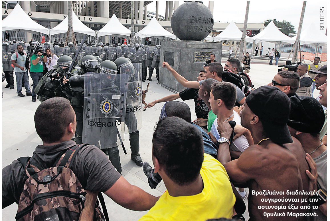
Βραζιλιάνοι διαδηλωτές συγκρούονται με την αστυνομία έξω από το θρυλικό Μαρακανά.

Να σημειωθεί ότι οι διαδηλώσεις γίνονται τη στιγμή που η Βραζιλία φιλοξενεί το Κύπελλο Συνομοσπονδιών. Στην τελετή έναρξης μάλιστα πριν από μερικές ημέρες, η κυρία Ρούσεφ αποδοκιμάστηκε από μερίδα του πλήθους. Η πολιτική των τελευταίων δέκα ετών, με τις υψηλές κοινωνικές δαπάνες και τις επιδοτήσεις που βοήθησαν τουλάχιστον 40 εκατομμύρια Βραζιλιάνους να ξεφύγουν από τη φτώχεια, φαίνεται να έχει φτάσει στο όριο της, όπως και η δημοτικότητα της κυρίας Ρούσεφ, που υποχώρησε τον Ιούνιο για πρώτη φορά από τότε που ανέλαβε τα