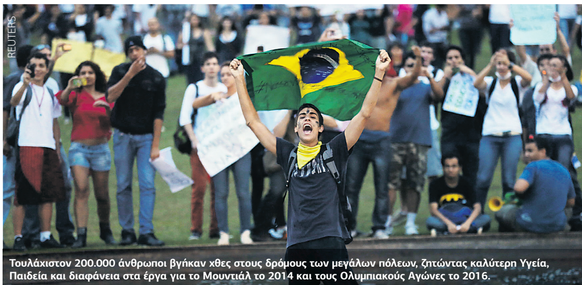
Τουλάχιστον 200.000 άνθρωποι βγήκαν χθες στους δρόμους των μεγάλων πόλεων, ζητώντας καλύτερη Υγεία, Παιδεία και διαφάνεια στα έργα για το Μουντιάλ το 2014 και τους Ολυμπιακούς Αγώνες το 2016.

Η κεντρική τράπεζα αυτό το μήνα παρενέβη με 5,7 δισ. δολάρια για να στηρίξει το νόμισμα της χώρας, ενώ επενδύτες εκτιμούν ότι τα συναλλαγματικά αποθέματα ύψους 375 δισ. $ είναι οριακά για να αντιμετωπίσουν μια μαζική φυγή κεφαλαίων. ■