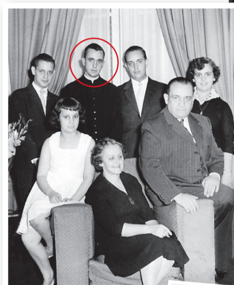
Ο Πάπας Φραγκίσκος (στον κόκκινο κύκλο) σε παλαιό οικογενειακό στιγμιότυπο.

Το κίνημα, που αναπτύχθηκε ως εξέλιξη της Καθολικής Εκκλησίας στη Λατινική Αμερική σε μια περίοδο δικτατοριών και καταπίεσης των λαών των χωρών αυτών από τυραννικά καθεστώτα, δεν άρεσε καθόλου στο Βατικανό που δεν ήθελε να διαταραχθεί το υπάρχον status quo. Ετσι, οι κληρικοί και οι επίσκοποι που απλώς προσπαθούσαν να θέσουν τις βάσεις για