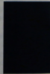
ΕΛΣΑ ΓΚΟΝΣΑΛΕΘ πρόεδρος της Ομοσπονδίας Ενώσεων Ισπανών Δημοσιογράφων