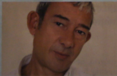
ΕΝΡΙΚ ΓΚΟΝΣΑΛΕΘ γνωστός δημοσιογράφος ο οποίος παραιτήθηκε από την El País