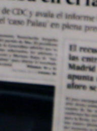
ΜΑΡΙΑ ΑΝΤΟΝΙΑ ΣΑΝΤΣΕΘ, συντάκτρια της El País