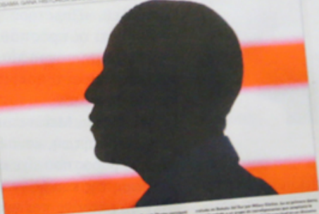
El primer candidato negro