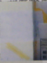
ΜΑΡΙΑ ΑΝΤΟΝΙΑ ΣΑΝΤΣΕΘ, συντάκτρια της El País