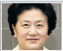
Λιου Γιαντονγκ, σύμβουλος του κράτους και μέλος του πολ. γραφείου

◀ Τα δέκα κορυφαία στελέχη και διεκδικητές μίας θέσης στη νέα Διαρκή Επιτροπή (οι ιδιότητές τους αφορούν τη θέση που κατέχουν τώρα)