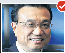
Λι Κεσιάνγκ, αναπλ. πρωθυπουργός