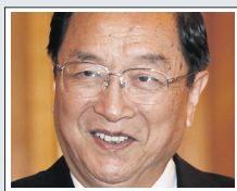
Γιου Ζενγκσένγκ, γραμματέας του κόμματος στη Σαγκάι