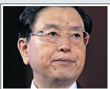
Ζανγκ Ντετζιάνγκ, αναπληρωτής πρωθυπουργός