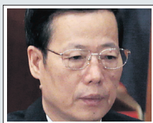
Ζάνγκι Γκαολί, γραμματέας του κόμματος στην επαρχία Τσιαντζίν