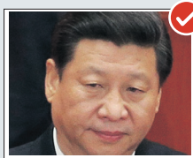
Σι Τζινπίνγκ, αντιπρόεδρος