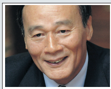
Γουάνγκ Κισάν, αναπληρωτής πρωθυπουργός