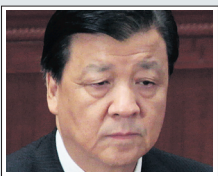
Λιου Γουινσάν, υπουργός Προπαγάνδας